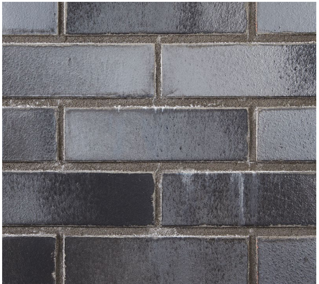
Auslaugungen an einem herkömmlichen Fugenmörtel